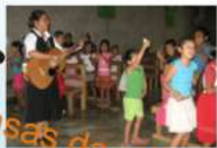
Casas de misión