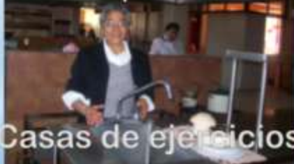
Casas de ejercicios