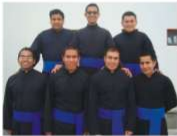
J. Carlos M. Ángel R. Pablo 5 14 24