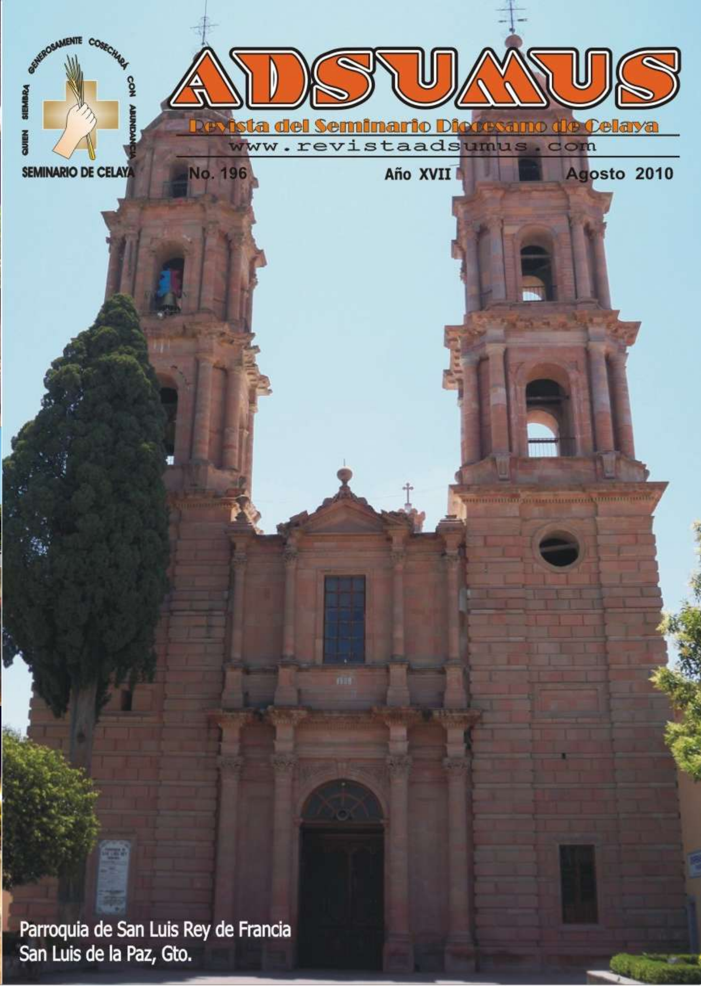
Parroquia de San Luis Rey de Francia San Luis de la Paz, Gto.