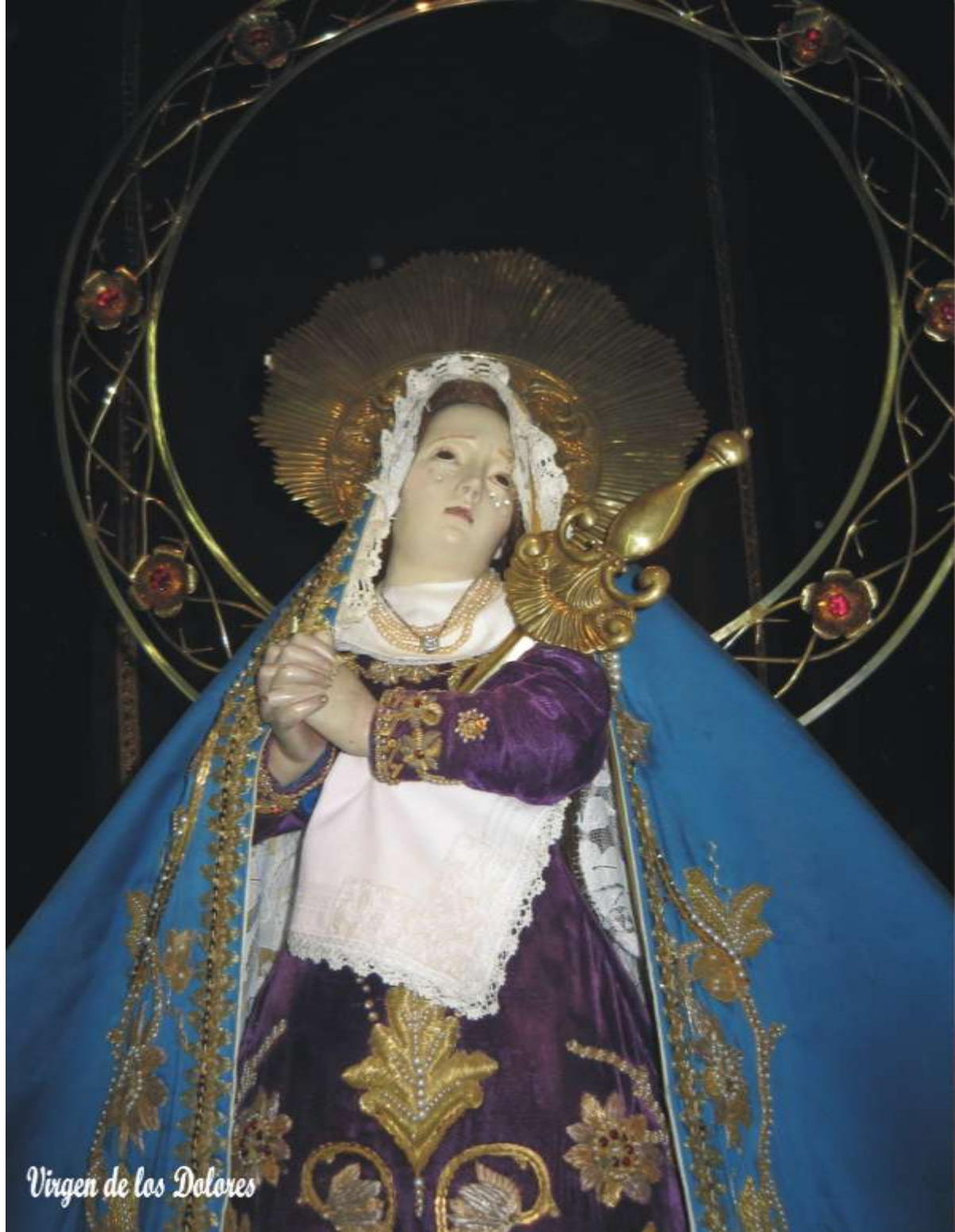
Virgen de los Dolores