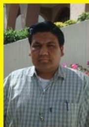
Juan Carlos 5